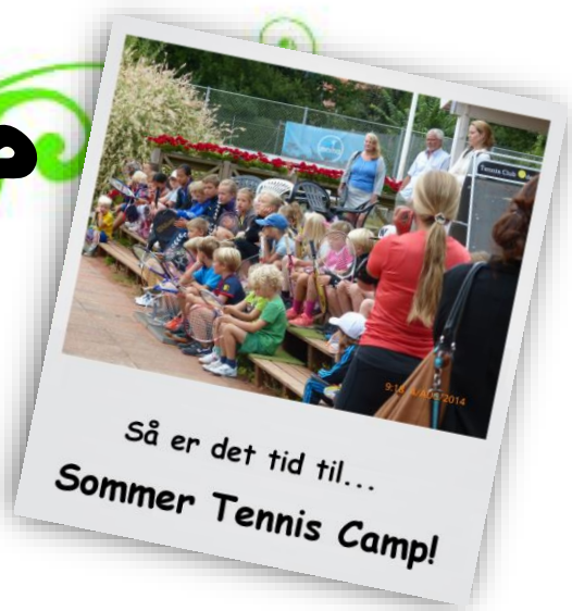
Så er det tid til... Sommer Tennis Camp!

Så er det endelig blevet tid til vores populære